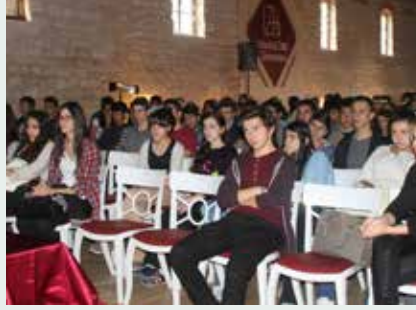
Bağcılar Mehmet Niyazi Altuğ Anadolu Lisesi