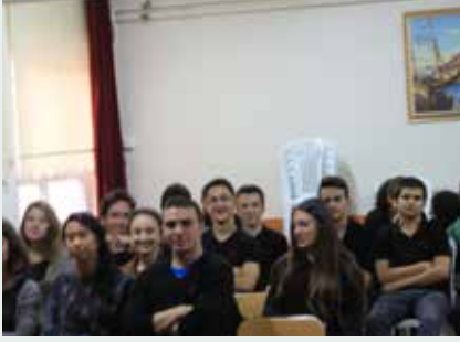
Küçükçekmece Fahrettin Kerim Gökay Anadolu Lisesi