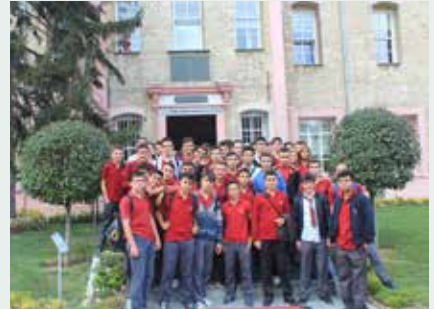
İsmet Aktar Teknik ve Endüstri Meslek Lisesi