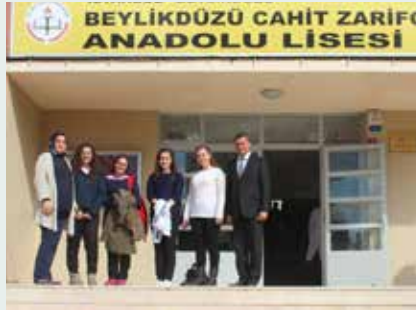
Beylikdüzü Cahit Zarifoğlu Lisesi