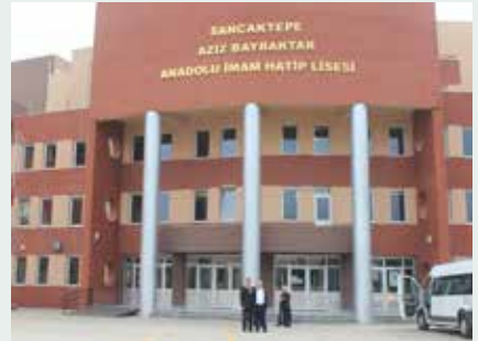
Sancaktepe Aziz Bayraktar Anadolu İmam Hatip Lisesi