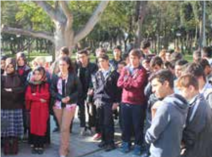
Toki Celalettin Ökten Anadolu İmam Hatip Lisesi