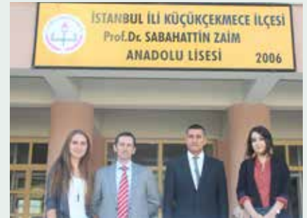
Küçükçekmece Prof. Dr. Sabahatin Zaim Anadolu Lisesi