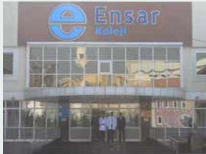
Başakşehir Ensar Koleji