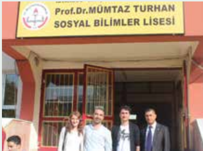
Bahçelievler Prof.Dr.Mümtaz Turhan Sosyal Bilimler Lisesi