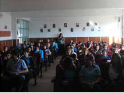
Küçükçekmece Toki Atakent Lisesi