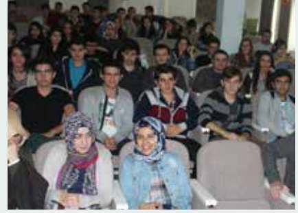
Esenler Amiral Vehbi Ziya Dümer Anadolu Lisesi