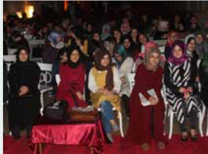
Avcılar Anadolu İmam Hatip Lisesi