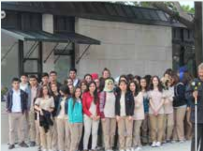
Bağcılar Aydın Doğan Anadolu Sağlık Meslek Lisesi