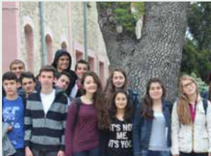
Beylikdüzü Yaşar Acar Fen Lisesi