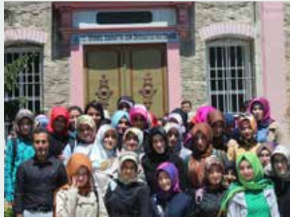
Esenler İmam Hatip Lisesi