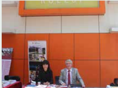
Beykoz Acarkent Doğa Koleji