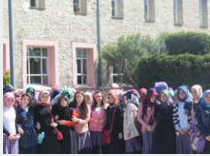
Gaziosmapaşa Kazım Karabekir Anadolu İmam Hatip Lisesi