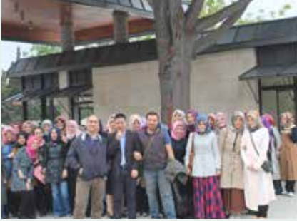
Bakırköy Anadolu İmam Hatip Lisesi