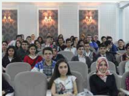
Bağcılar Gazi Lisesi