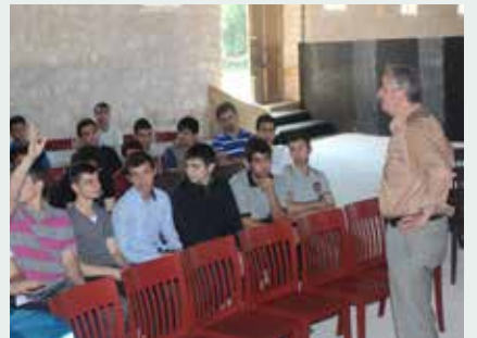
Gebze Anadolu İmam Hatip Lisesi