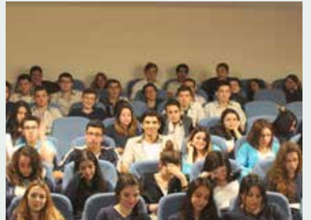
Bahçeşehir Okyanus Koleji