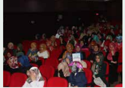
Üsküdar Esatpaşa Anadolu İmam Hatip Lisesi