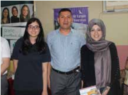
Başakşehir Ensar Koleji