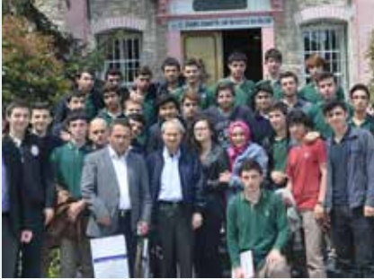
Kadıköy Erkek Anadolu İmam Hatip Lisesi