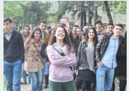
Bağcılar Uğur Derşhanesi