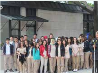
Bağcılar Aydın Doğan Anadolu Sağlık Meslek Lisesi