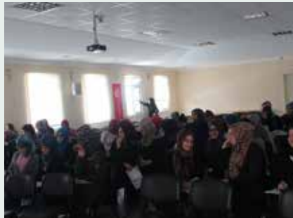
Maltepe İrfan Dershanesi