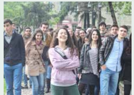
Bağcılar Uğur Derşhanesi