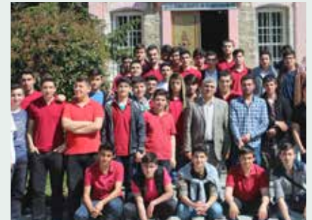
İstanbul Anadolu İmam Hatip Lisesi